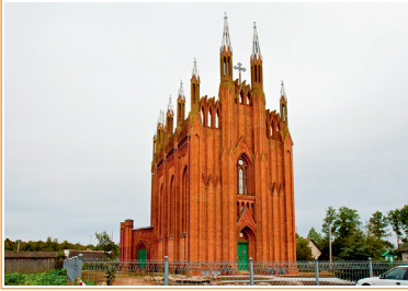
Die Kirche Mariä Himmelfahrt im Dorf Sarja (Werchnedwinsk Kreis), gebaut 1853 aus rotem Ziegel.